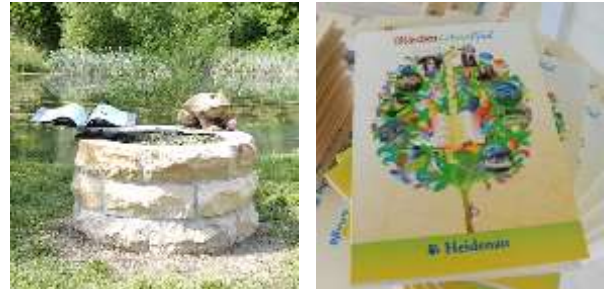
Abb. 1 Märchenstation „Der Froschkönig“ (links), Märchenbuch (rechts)

Der Märchenpfad ist ein fantasievoller Ansatz die Märchenwelt zu erleben und dabei die eigene Stadt zu erkunden.