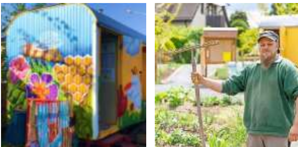
Abb. 4: Bürgergarten Heidenau Südwest Quellen: Stadtverwaltung Heidenau, die STEG, 2022

Der Bürgergarten verbindet gemeinschaftliches Gärtnern mit Möglichkeiten des handwerklichen Ausprobierens und Lernens. Der Garten ist ein Ort, für eine besondere Form aktiver Erholung, Ruhe und Ausgleich.