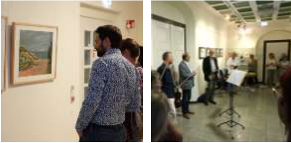
Abb. 3: Wechselausstellungen im Rathaus Heidenau

Wechselausstellungen im Heidenauer Rathaus bieten (Hobby-)Künstlern aus Heidenau und der Region die Möglichkeit, ihre Arbeiten öffentlich zu zeigen. Jede neue Ausstellung wird mit einem kleinen Rahmenprogramm eröffnet.