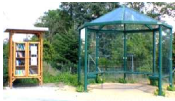
Abb. 2: Bücherschrank an der Bushaltestelle Großsedlitz

Büchertauschschränke erfreuen sich auch in Heidenau zunehmender Beliebtheit. In einem Gemeinschaftsprojekt der Stadt Heidenau und der CJD-Holzwerkstatt wurden bislang drei Tauschschränke aufgestellt, zwei in den ländlichen Gemarkungen Gommern und Großsedlitz und einer am Brunneneck in der Gemarkung Mügeln.