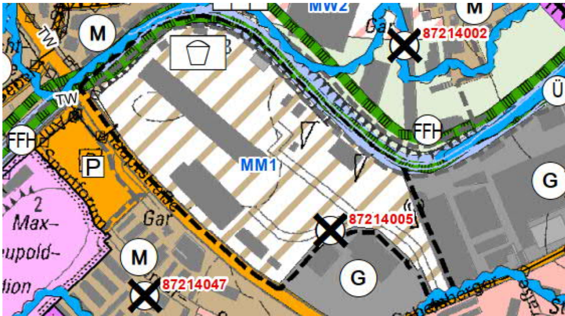
Abbildung: Auszug Vorentwurf FNP Fassung vom 13.02.2018

Getreu dem Entwicklungsgebot des § 8 Abs. 2 Satz 1 BauGB sind Bebauungspläne aus dem Flächennutzungsplan zu entwickeln. Der Stadtrat der Stadt Heidenau hat am 22.06.2017 die Aufstellung des Flächennutzungsplanes (FNP) der Stadt Heidenau beschlossen. Der Vorentwurf zur frühzeitigen Beteiligung hat in der Zeit vom 12.03.2018 bis einschließlich 09.04.2018 öffentlich ausgelegen. Der als vorbereitende Bauleitplanung dienende FNP befindet sich weiterhin im Planprozess. Er hat derzeit noch keine Rechtskraft erlangt.