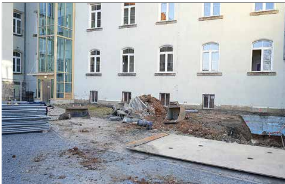
Schulgebäude der Oberschule „J. W. v. Goethe“

Die Sanierung erfolgt bei laufendem Schulbetrieb, was für Schüler, Lehrer und