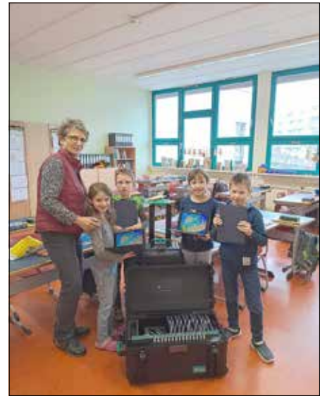
Im Rahmen des Digitalpaktes erhielten auch die Schülerinnen und Schüler der Astrid-Lindgren-Grundschule Tablets für den digitalen Unterricht.

Auch sportlich ist an der Astrid-Lindgren-Grundschule mächtig was los. 2007 mit dem „Sportgütesiegel“ ausgezeichnet und 2009 als „Sportfreundliche Schule“ geehrt, erhielt die Schule 2013 das Gütesiegel als „Bewegte Grundschule“ bereits zum zweiten Mal. Im Jahr 2025 erreichte die Astrid-Lindgren-Grundschule u.a. mit ihrer bewegten Hofpause, dem Fokus auf „Den Schulweg meistern wir zu Fuß!“ und intensiver Fortbildung des Lehrer-Teams das Zertifikat „Schule in Bewegung“.