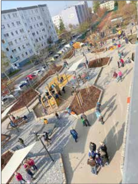
2019 wurde der Schulhof der Astrid-Lindgren-Grundschule neu gestaltet.

In diesem Jahr feiert die Astrid-Lindgren-Grundschule ihr 40-jähriges Bestehen. Genauer gesagt: Der Schulstandort, welcher 1986 im Zuge der Entstehung des Neubaugebietes Mügeln entstand. Mit 26 Unterrichtsräumen und einer neuen 450 m 2 großen Sporthalle war die Mügeln Schule die erste dieses Bautyps im Kreis Pirna.