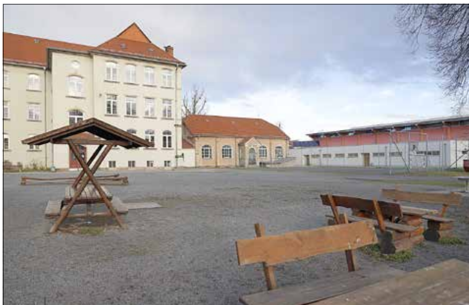
Alte Turnhalle (Bildmitte)

Diese Maßnahme wird mitfinanziert durch Staatsermittelte auf der Grundlage des vom Sächsischen Landtag beschlossenen Haushaltes.