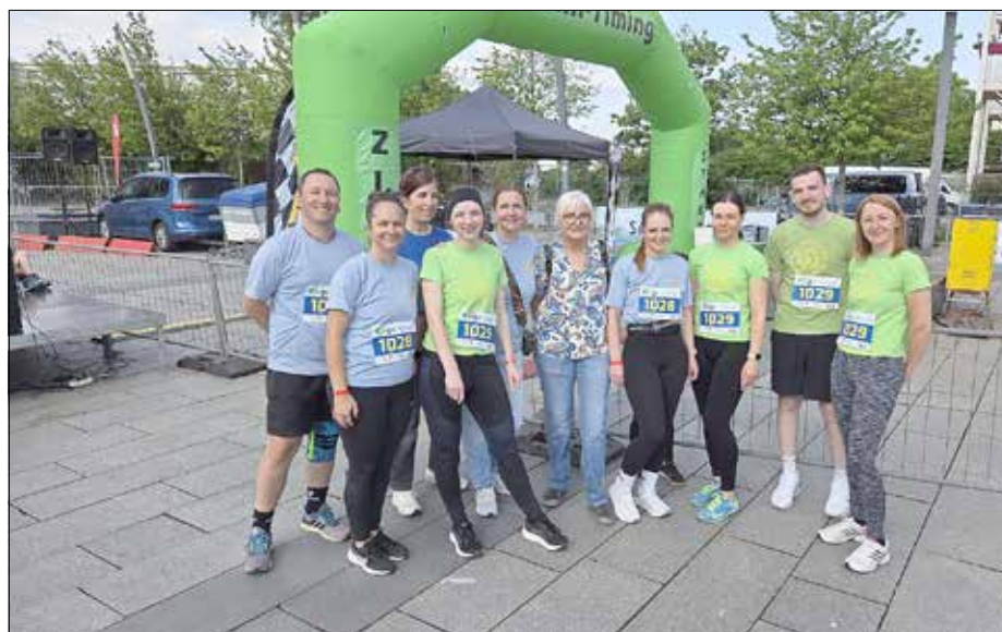
Grundschule „Bruno Gleißberg“

Dank gilt unserem Förderverein, der die Teilnahmegebühren für alle Kinder übernommen hat.