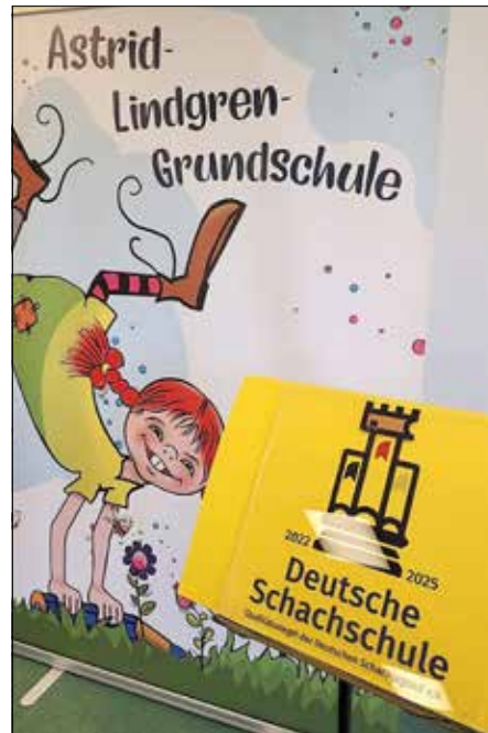
Die Astrid-Lindgren-Grundschule erhielt mehrfach die Auszeichnung zur „Deutschen Schachschule“.

Neben unterschiedlichen Ganztagsangeboten, Sternenstunden zur gezielten Förderung von Kindern mit Begabungen und DaZ-Klassen (Deutsch als Zweitsprache) sind die Schüler und Lehrer besonders stolz auf das bereits mehrmals verliehene Qualitätssiegel „Deutsche Schachschule“.