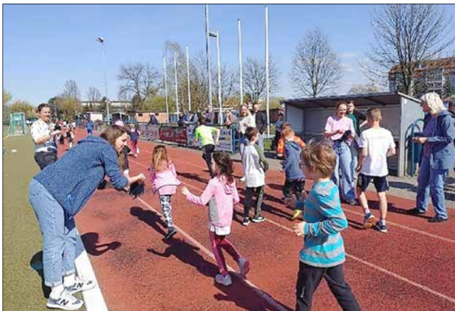
Grundschule „Bruno Gleißberg“

Der Sponsorenlauf war nicht nur ein sportlicher Erfolg, sondern auch ein starkes Zeichen für Gemeinschaft und Zusammenhalt. Die gesammelten Spenden werden nun gezielt eingesetzt, um das Schulleben weiter zu bereichern.