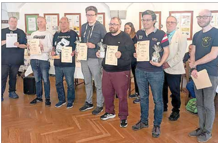
Preisvergabe der ersten fünf Plätze: Turnierleiter, die Plätze 2, 1, 3, 4, 5, Hauptschiedsrichter, Mitglied des Orga-Teams

Austragungsort für das Turnier war das Gasthaus „Drogenmühle“ in Heidenau, was sich als eine sehr gute Wahl erwies. Die besondere Atmosphäre der Räumlichkeiten wurde von vielen Teilnehmern ausdrücklich gelobt. Der Heidenauer Schachverein bedankt sich herzlich für die Unterstützung