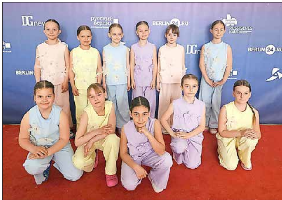
Batterie-Kids SSV Heidenau e.V.

Teilnehmende als auch Zuschauende begeisterten. Auf dem roten Teppich fand die feierliche Auszeichnung aller Teilnehmenden statt, bei der die Tänzerinnen des SSV Heidenau stolz ihre Preise entgegennehmen konnten.