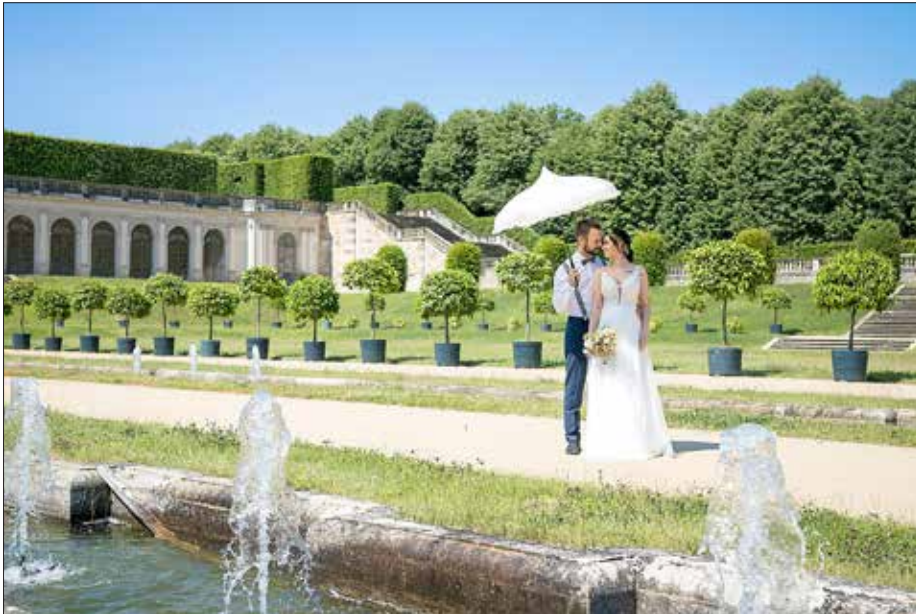
Brautpaar vor der Unteren Orangerie des Barockgarten Großsedlitz

eleganten Rahmen. Feiern wie zu Königs Zeiten können Sie bei uns natürlich auch andere Anlässe bspw. wie Geburtstage, Sommerfeste, Goldene Hochzeiten.