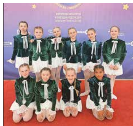
Batterie SSV Heidenau e.V.

Das Festival war für alle Beteiligten ein Tag voller Emotionen und Frühlingsstimmung. Neben den spannenden Wettbewerbsauftritten bot das Event auch zahlreiche Konzerte und Showeinlagen, die sowohl