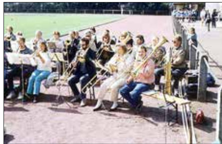
1990 gemeinsames Platzkonzert in Heildesheim