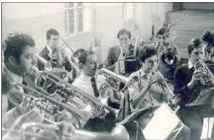
1982 Erster gemeinsamer Gottesdienst in Heidenau