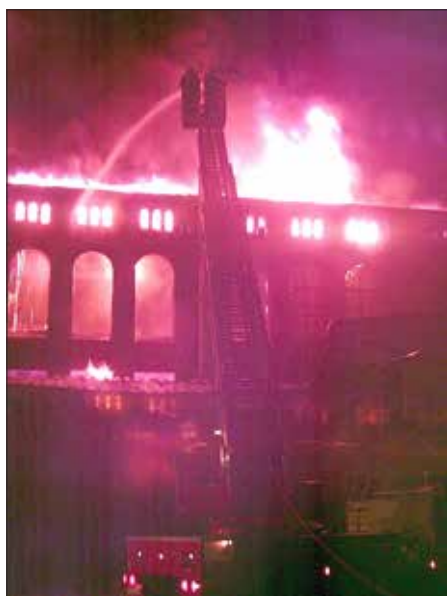
14.03.2004 Brand des ehemaligen Druckmaschinenwerkes Victoria, G.-Scholl-Straße

Über die vergangenen Jahre haben sich die Einsatzzahlen wechselhaft entwickelt, insgesamt jedoch auf einem höheren Niveau eingependelt. Während im Jahr 2008 noch 113 Einsätze zu verzeichnen waren, stieg die Zahl bis 2024 auf 273 an. Für das zurückliegende Jahr 2025 wurden 224 Einsätze registriert.