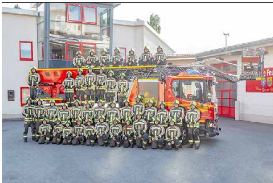
Kameradinnen und Kameraden der Freiwilligen Feuerwehr Heidenau