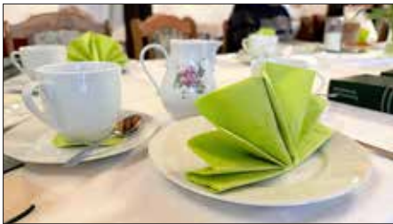
Senioren singen in schöner Atmosphäre

Einmal im Monat erfüllt Gesang den Raum hinten rechts in der Drogenmühle: Dann treffen sich sangesfreudige, überwiegend ältere Heidenauerinnen und Heidenauer zum gemeinsamen Singen. Nach Stationen in Heidenau-Süd und im Gemeindezentrum der Christuskirche hat die Runde hier ein neues Zuhause gefunden. Während der Umbaumaßnahmen am Gemeindezentrum entstand zunächst eine Übergangslösung – doch der schöne Raum, das gut gestimmte Klavier und die freundliche Bewirtung überzeugten schnell.