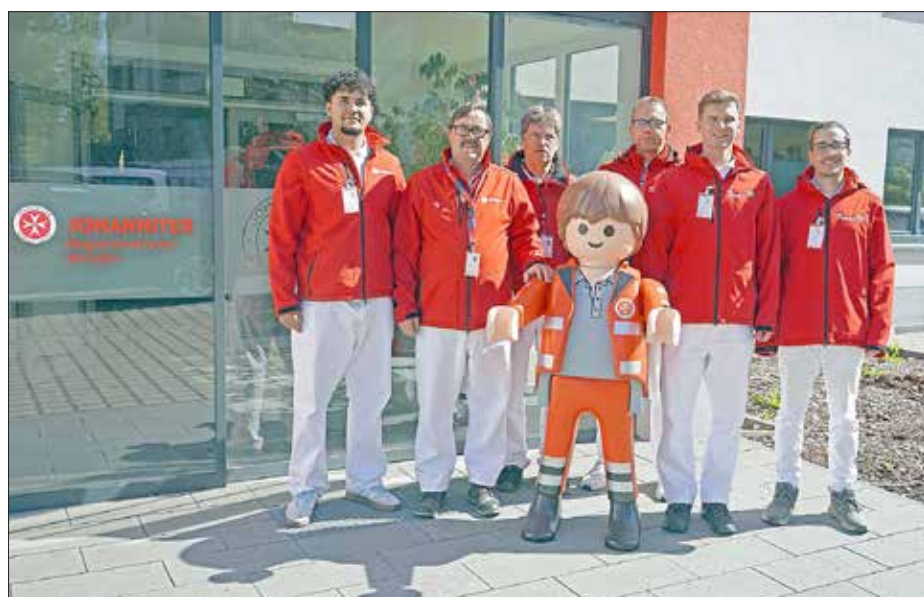
Team der Johanniter-Botschafter