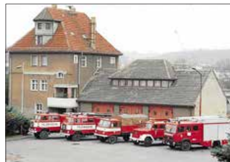
Gerätehaus, ca. 1993-1995

die Farbanstriche dunkelgrün und mussten das Hoheitszeichen der Polizei tragen. Die Aufschrift lautete „Feuerlöschpolizei“. Von 1941 bis 1945 waren auch für unsere Kameraden zum Heeresdienst eingezogen wurden, gründetet man eine Jugendgruppe. Diese kam mit älteren Kameraden zum Einsatz. Am 13. und 14. Februar 1945 waren die Kameraden 19 Stunden in Dresden im Einsatz.