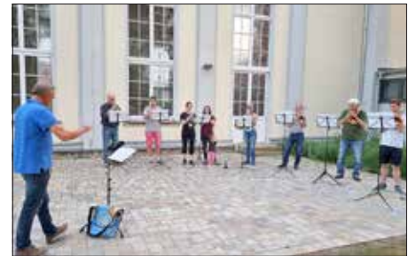
2022 Abendmusik unserer Gäste in Heidenau