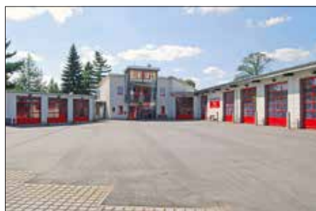
Gerätehaus heute

Auf Grund der vielen technischen Veränderungen, der Voraussetzungen und auch der Größe der Fahrzeuge kam die Wehr räumlich sehr oft an ihre Grenzen, vor allem mit der Beschaffung einer Drehleiter 23/12, welche Übergangsweise im Areal des ehemaligen Automot untergestellt werden musste. 1997 kam es zur Übergabe einer neuen Fahrzeughalle, sodass von nun an alle Fahrzeuge, wenn auch sehr eng, in unserem Objekt einen Platz fanden. Im Jahre 2005 begann der Bau eines neuen Gerätehauses am alten Standort. Nach einem Jahr Bauzeit wurde dann ein zu dieser Zeit den gesetzlichen Anforderungen entsprechendes Gerätehaus eingeweiht.