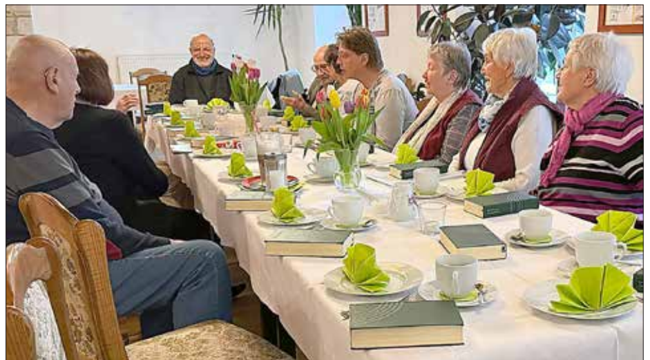
Der Singekreis freut sich auf neue Mitstreiter!

Kontakt: Frau Geißler, Tel. 597 39 75 oder 0171 141 65 65