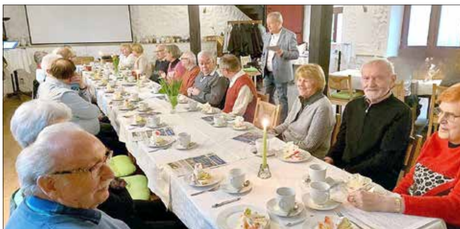
Sammlerfreunde bei Kaffee und Kuchen