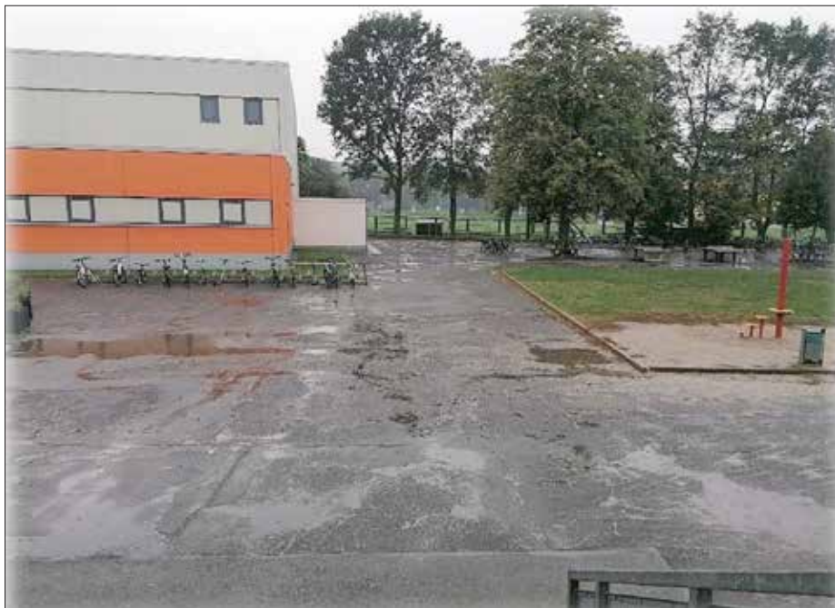
Schulhof der Grundschule „Bruno Gleißberg“