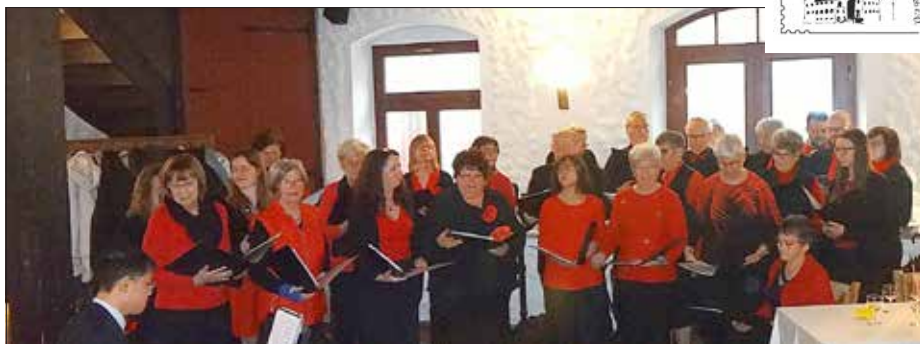
Heidenauer Singekreis am 21.03.2026 in der Drogenmühle