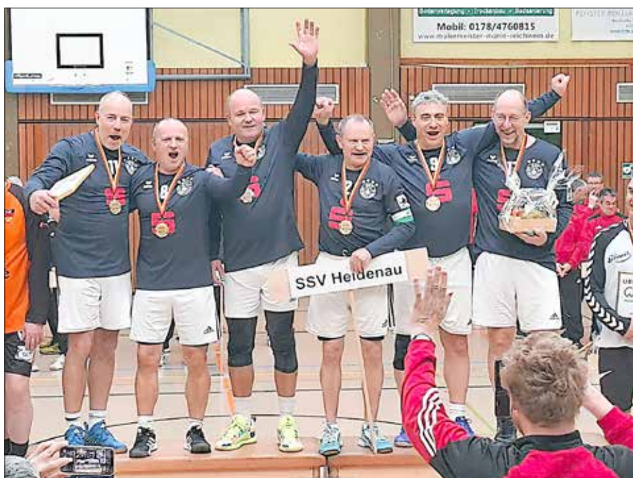
SSV Heidenau (M55) - Deutscher Hallen-Meister 2026/27