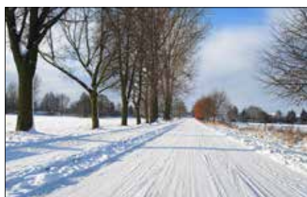
Winter auf der Elbstraße

Soweit entlang einer öffentlichen Straße keine Straßenrinne vorhanden ist, gilt ein Streifen von 0,50 m Breite unmittelbar am Fahrbahnrand als Straßenrinne.