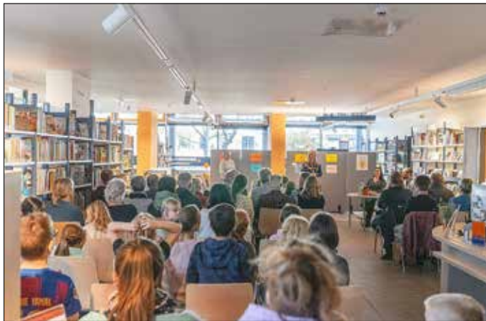
Zahlreiche Gäste fanden den Weg zum Vorlesewettbewerb der Grundschulen in die Stadtbibliothek.