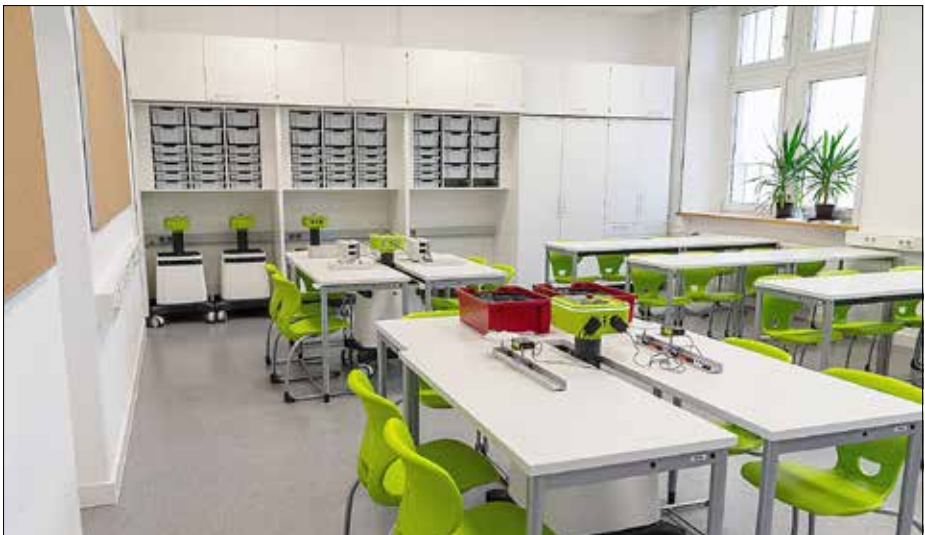
Physik-Kabinett im Pestalozzi-Gymnasium