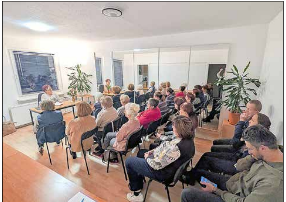
Veranstaltungsreihe „Menschen erzählen ihre Lebensgeschichte“

Der Nachbarschaftsverein e.V. und das Team „Gemeinsam in Heidenau“ teilen