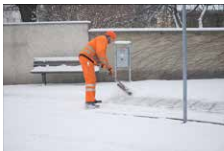
Die Mitarbeiter des städtischen Bauhofes machen für Sie den Weg frei: ob manuell oder motorisiert.

In der kalten Jahreszeit sind die Mitarbeiter des städtischen Bauhofes besonders gefordert. Denn nun kommt oftmals zu den umfangreichen regelmäßigen Arbeitsbereichen zusätzlich der Winterdienst hinzu. Um Sie sicher durch den Winter zu bringen, sind aber alle Seiten gemeinsam gefragt. Im Winter muss jederzeit und überall mit Frostgefahren oder Schneefällen gerechnet werden. Deshalb wollen wir an dieser Stelle die Straßenanlieger dringend an ihre aufgrund der Straßenreinigungssatzung der Stadt Heidenau bestehenden Räum- und Streupflichten erinnern.