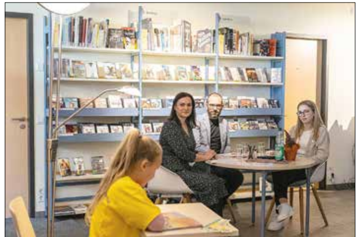
Die Jury lauschte aufmerksam den Vortragenden Teilnehmern.