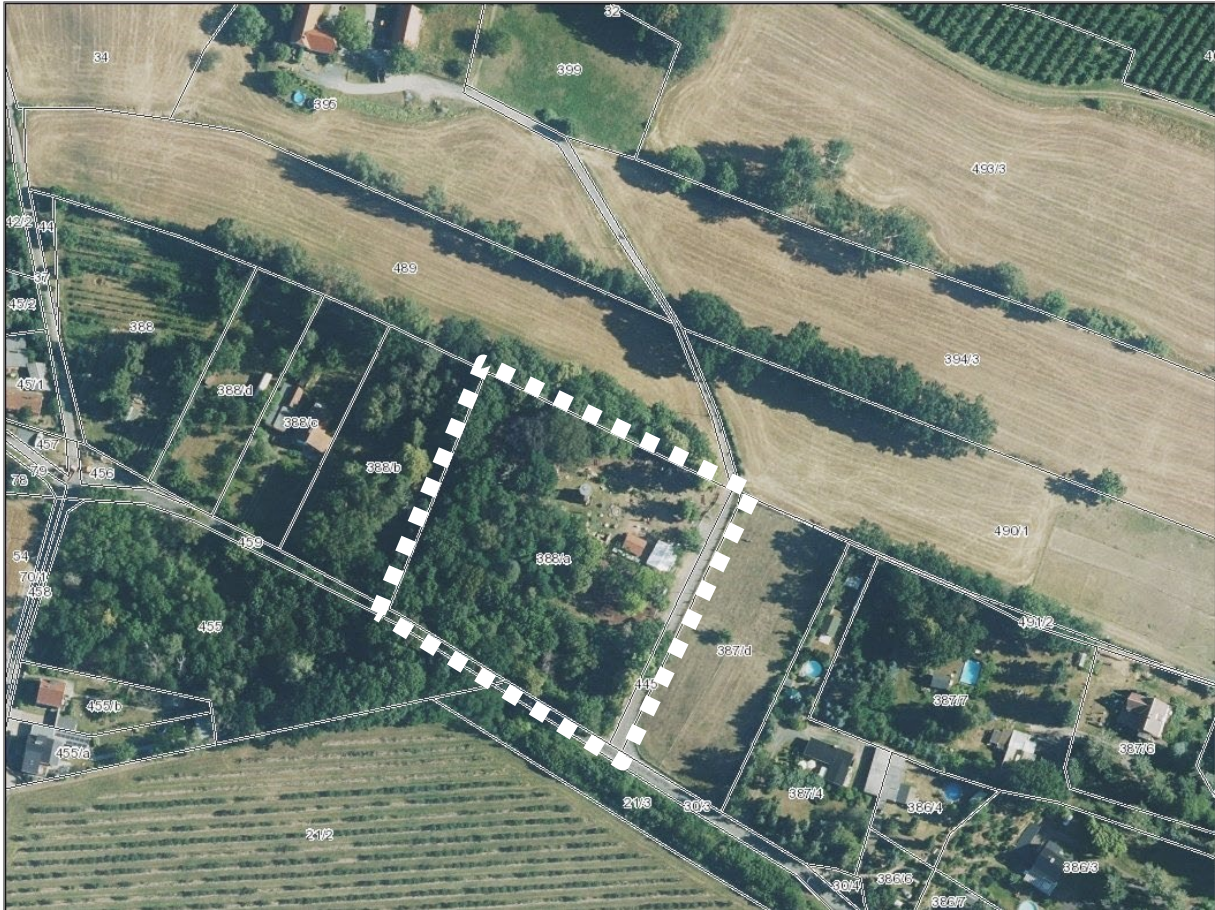
Abb. 1: Plangebiet „Am Lutgurm“ in Heidenau (Übersichtsplan mit B-Plan-Geltungsbereich, Kartengrundlage: Geoportal Sachsenatlas)

Folgende am Standort bereits vorhandenen Anlagen sollen erhalten und tlw. weiterentwickelt werden: