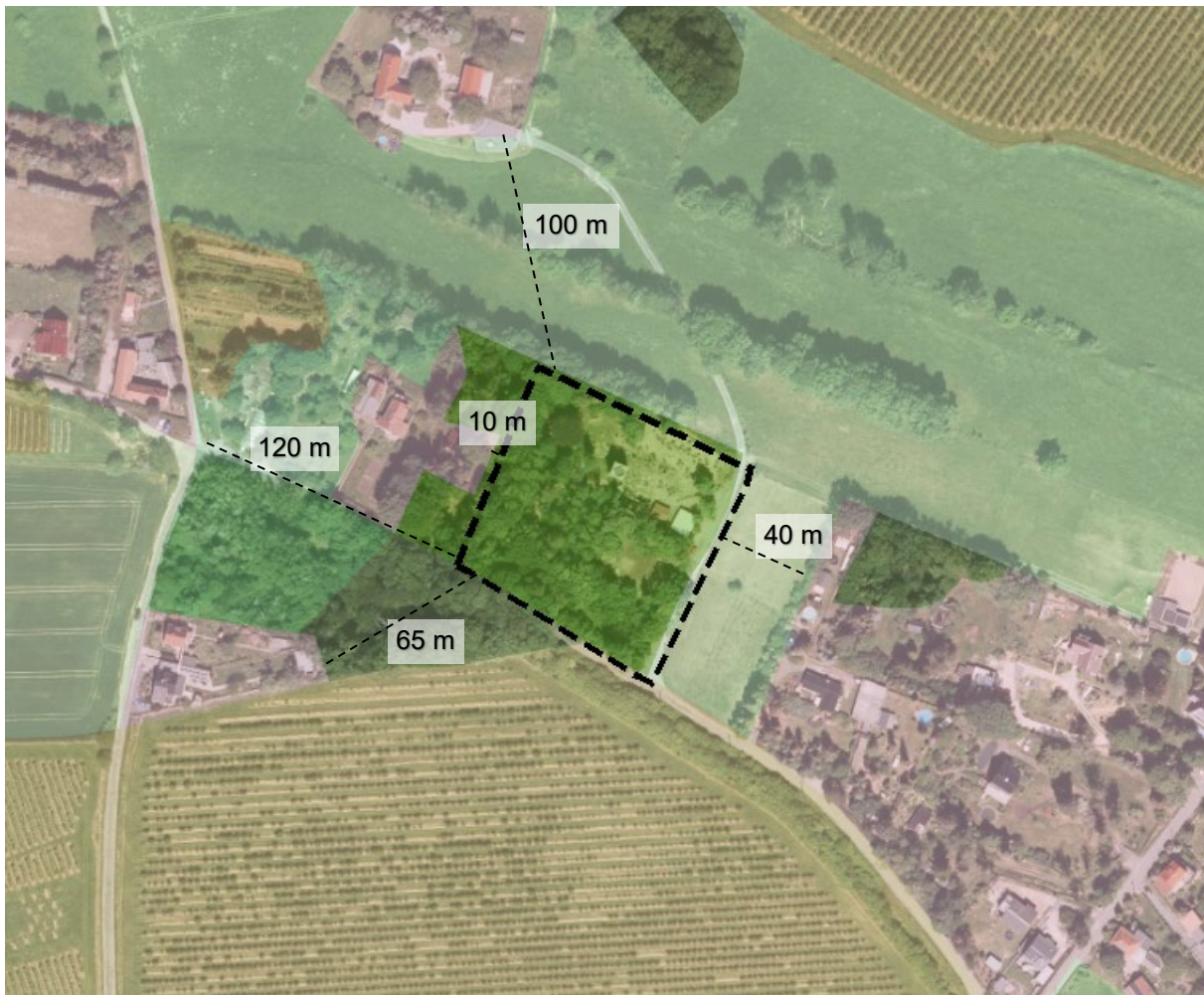
Abbildung 1: Abstände Plangebiet zu nächstgelegenen Wohnbebauungen (Luftbild mit Überlagerung Biotoptypen- und Landnutzungskartierung BTLNK 2 )

Der Lugturm als Freizeit- und Erholungsattraktion wird von Touristen sowie von der einheimischen Bevölkerung als Ausflugsziel genutzt. Lange Zeit war der Aussichtsturm der Bevölkerung nicht zugänglich, dieser wird jedoch aktuell restauriert und soll somit nach Ablauf der Sanierungsmaßnahmen wieder als solcher zur Verfügung stehen. Am Fuß des Turmes besteht aktuell eine bereits genehmigten Ausschankhütte, welche bei schönem Wetter Getränke und Imbisse anbietet.