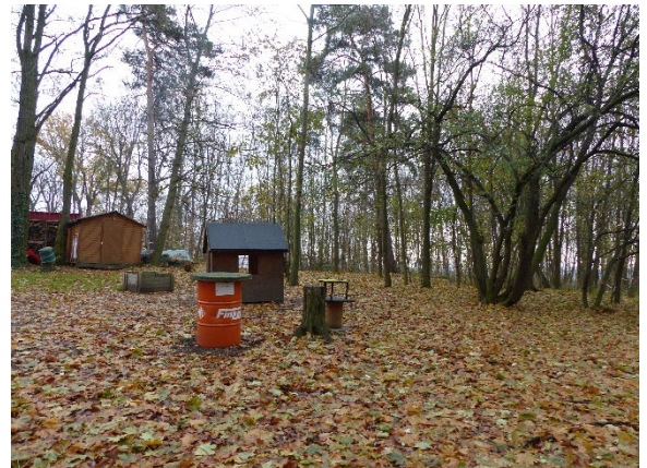
Foto 12: Übergang zwischen gastronomisch genutztem Bereich und Gehölzbereich (Nov. 2022)