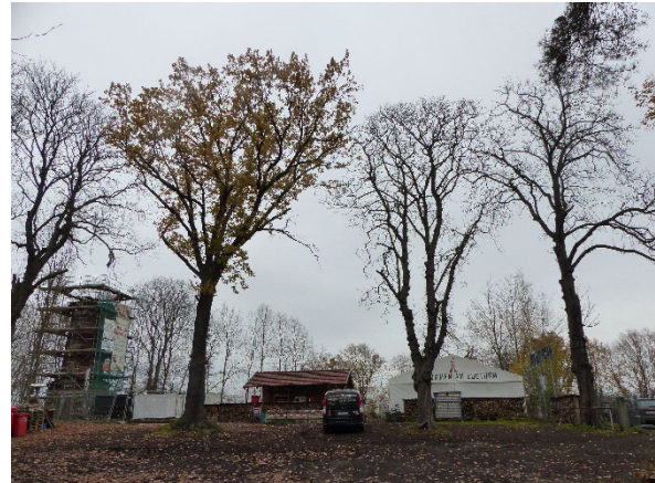
Foto 10: Blick vom Parkplatz zum gastronomisch genutzten Bereich (Nov. 2022)