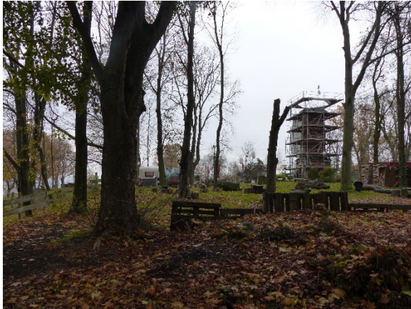
Foto 1: Großgehölze; dahinter gastronomisch genutzter Bereich und Lugturm (Nov. 2022)

Im Süden des Plangebietes grenzt direkt ein Vorranggebiet und daran anschließend ein Vorbehaltsgebiet des Arten- und Biotopschutzes des Regionalplanes an. 8