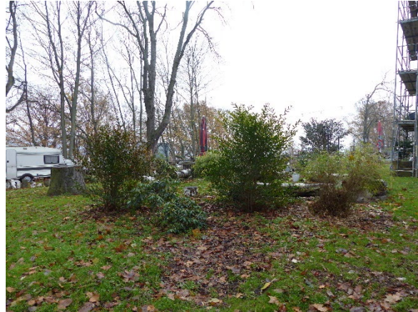
Foto 2: Bepflanzungen im gastronomisch genutzten Bereich; dahinter Großgehölze (November 2022)