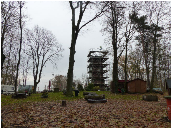
Foto 7: Gastronomisch genutzter Bereich und Luturm in Sanierungsphase (Nov. 2022)

Das Landschaftsbild um das Plangebiet ist vor allem durch die umgebenden Obstplantagen, Grünland und Gehölzstrukturen geprägt. Das Plangebiet selbst weist eine besondere Bedeutung für die landschaftsbezogene Erholung auf.