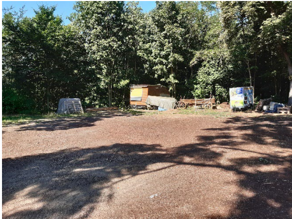
Foto 3: Parkplatzbereich mit anschließendem dichten Gehölzbereich (Juli 2022)